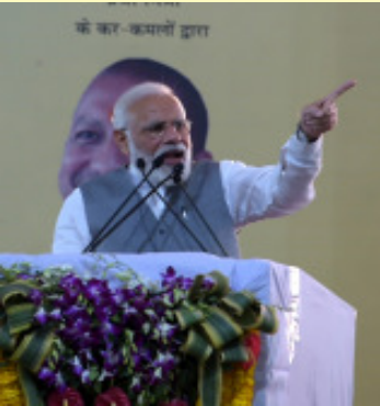
सेना की स्ट्राइक से विरोधियों पर जमकर बसरे मोदी

गाजियाबाद : प्रधानमंत्री नरेंद्र मोदी की प्लीट सिकंदरपुर स्थित सभास्थल से एयरबेस वापस पहुंची और फिर यहां से मोदी शहीद स्थल न्यू बस अड्डा मेट्रो स्टेशन के लिए रवाना हुए। पीएम की सुरक्षा की दृष्टि से ट्रैफिक पुलिस ने शाम 6:20 पर ही करीब आधा दर्जन प्वाइंट पर ट्रैफिक रोक दिया गया। पीएम ने 6:50 पर मेट्रो स्टेशन परिसर में प्रवेश किया। इस दौरान करीब 52 मिनट के लिए ट्रैफिक रोका गया। हालांकि कई प्वाइंट पर इससे अधिक समय भी लगा।